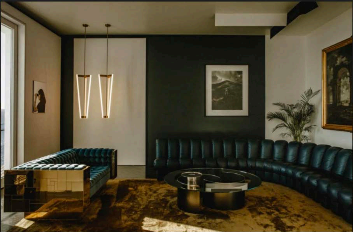
Un appartement à Naples. An apartment in Naples.